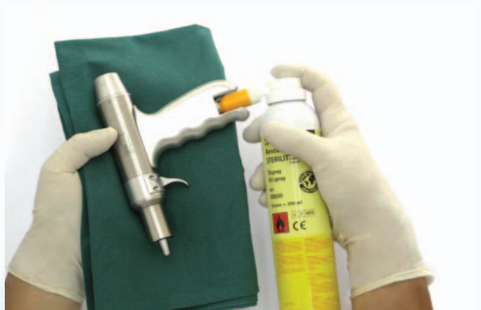
ej. lubricación del interior del taladro micro-line GB200 con Sterilit® GB600 y adaptador GB600810