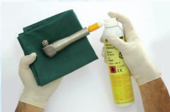
ej. lubricación del interior de la sierra oscilante micro-line GB129 con Sterilit® GB600 y adaptador GB600810