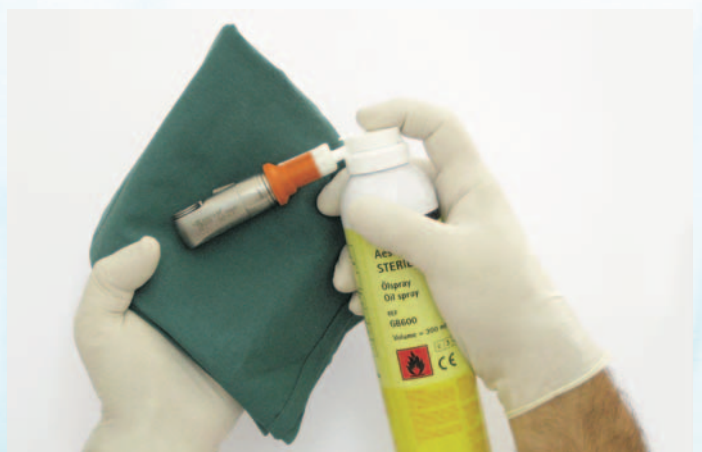
ej. lubricación del interior de la sierra mini-line GB390R con Sterilit® GB600 y adaptador GB600830