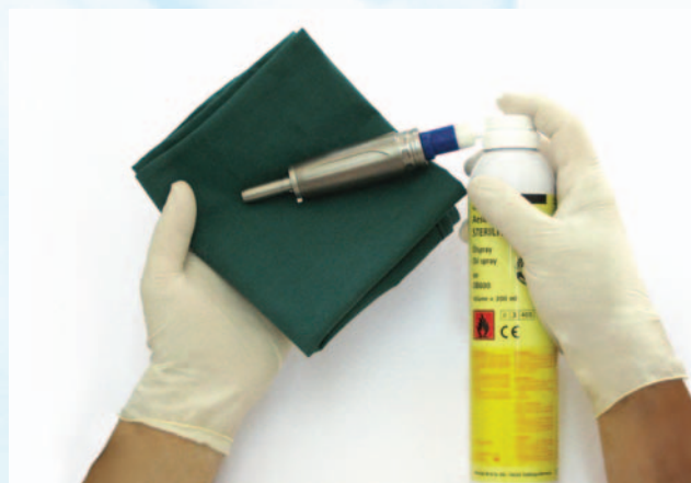
Lubricación del motor Microspeed uni GB678 + Sterilit® GB600 con adaptador GB600820

Una vez lubricado se debe hacer funcionar el motor durante 20 segundos aproximadamente, cambiando varias veces el sentido de la marcha y eliminar el aceite sobrante con un paño que no deje pelusas.