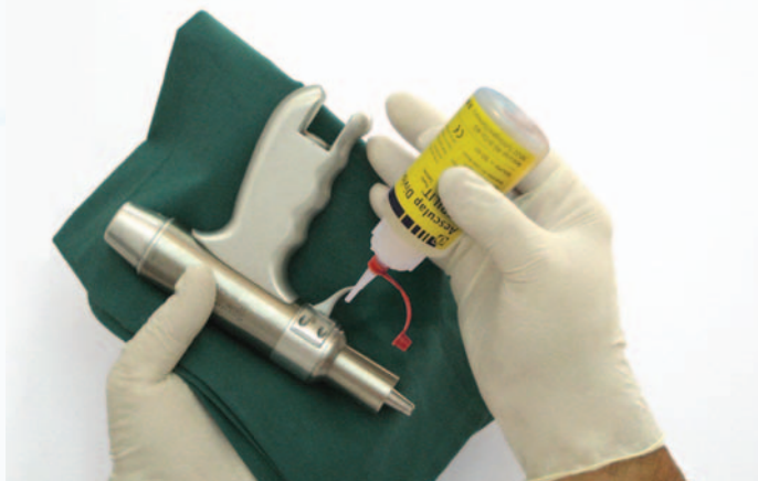
ej. lubricación del gatillo del taladro GB200 con Sterilit® M GA059