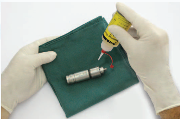
ej. Jacobs mini-line GB383R + Sterilit® GA059