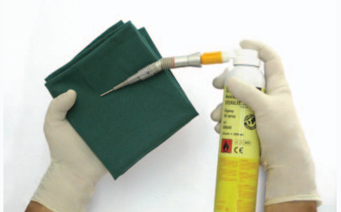
ej. pieza de mano angulada GD455M + Sterilit® adaptador GB600810