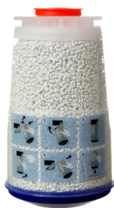
Canister desechable 1,2 L