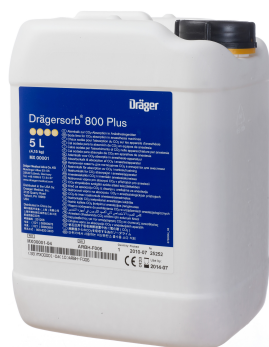
Garrafa de 5 litros para canisters reutilizables

La cal sodada Drägersorb® 800+ reduce significativamente la generación de productos de descomposición en caso de que la cal sodada se seque accidentalmente antes de su uso. Se puede usar con todos los tipos de agentes halogenados. Por supuesto, solo la cal sodada fresca garantiza unos resultados óptimos. El cambio de color de blanco a violeta indica que la cal sodada debe ser cambiada.