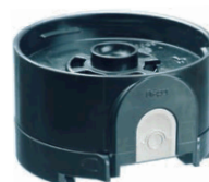
Adaptador para canister desechable